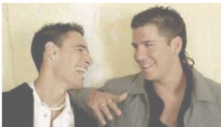
El sábado actuarán Andy y Lucas en la localidad.

El próximo jueves 5 de agosto comienza la Feria de Algarrobo, las actividades organizadas tendrán lugar a las ocho de la tarde con la gran cabalgata de gigantes y cabezudos. A las 10 de la noche el pregonero dará el pistoletazo de salida, a continuación se realizará un desfile de trajes regionales con la participación de los coros y danzas de la localidad. En el recinto ferial a partir de las doce se celebra el día del niño.