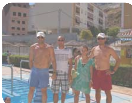
Los monitores enseñan a disfrutar del agua.