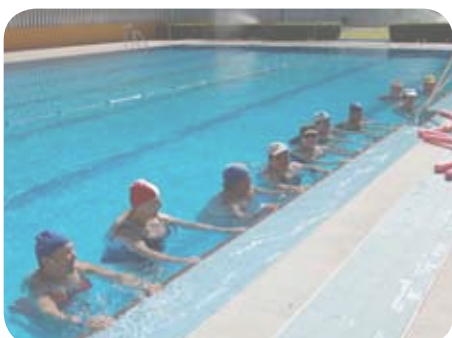
Los mayores demuestran que la edad no importa.