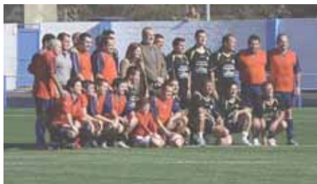
Políticos y concejales estrenaron el campo.

El Ayuntamiento invierte 420.000 euros en su instalación