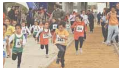
La participación de los pequeños fue masiva.

Los más pequeños tuvieron mucha presencia en esta edición.