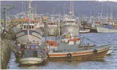
El corredor ferroviario

El pasado 27 de noviembre de 2009 se celebró el último pleno ordinario del año, en el que se aprobaron tres mociones presentadas con el apoyo de todos los grupos políticos.