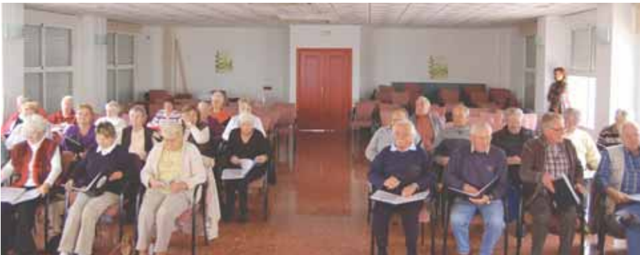
El Internationaler Shanty-Chor Costa del Sol, e.V. está formado por unas 88 personas .

El Internationaler Shanty-Chor Costa del Sol, e.V. se fundó en el año 2001 por nueve personas de nacionalidad alemana que conocían los cantos del norte de su país. Encontraron en esta actividad una forma de compartir los problemas a los que se enfrentaba un extranjero.