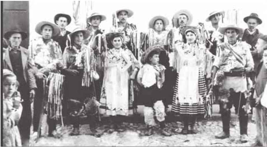
Pastoral original Manuel `El Chavea´.

Los 31 miembros de la pastoral Manuel `El Chavea´ pusieron en pie a todos los asistentes del Certamen de cantos de Navidad `Villa de Algarrobo´