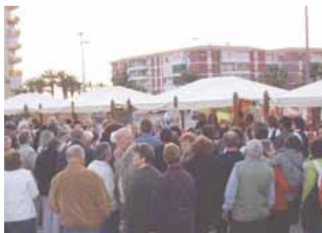
Cientos de personas visitaron el Mercadillo.

La actuación de la pastoral de la localidad y de varios coros alemanes dieron el toque musical a la jornada