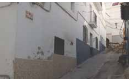
La obras de mejora renovarían las infraestructuras.

Invertirán 170.000 euros en el proyecto que tendrá un plazo de ejecución de seis meses