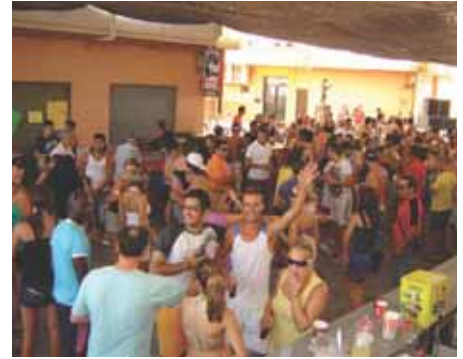
Feria de día en las calles de Mezquitilla.