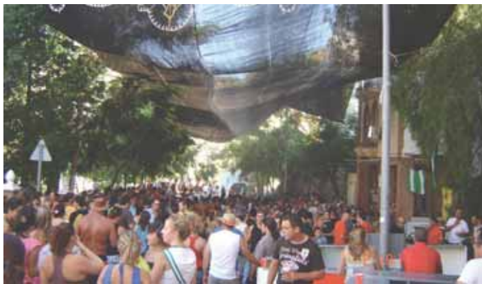
Las calles de Algarrobo recibieron a cientos de personas en la feria de día.