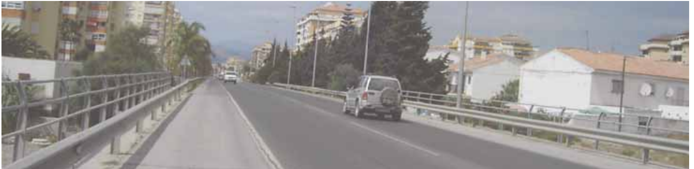
Die Nationalstrasse 340 wird in Algarrobo-Costa und Mezquitilla den Durchfahrtsverkehr verbessern. Es werden erhöhte Fußgängerüberwege errichtet die gleichzeitig die Geschwindigkeit kontrollieren.

Das Rathaus von Algarrobo hat den Titel über die Nationalstrasse 340, die an der Küste verläuft, erhalten. Nachdem der Auftrag zur Projekterstellung vergeben wurde, können die Arbeiten am Jahresende beginnen. Die National-