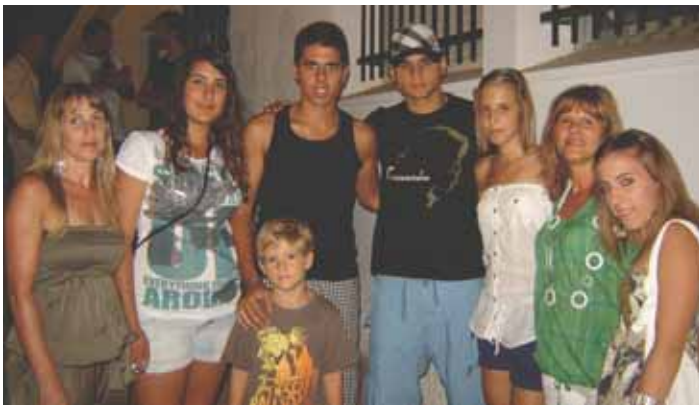
Miembros de la Junta de Festejos de Algarrobo con Sin Lache.