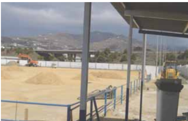
Han comenzado las obras de instalación del césped artificial.

El pasado 17 de agosto comenzaron las obras de acondicionamiento del campo de fútbol 'La Vega'.