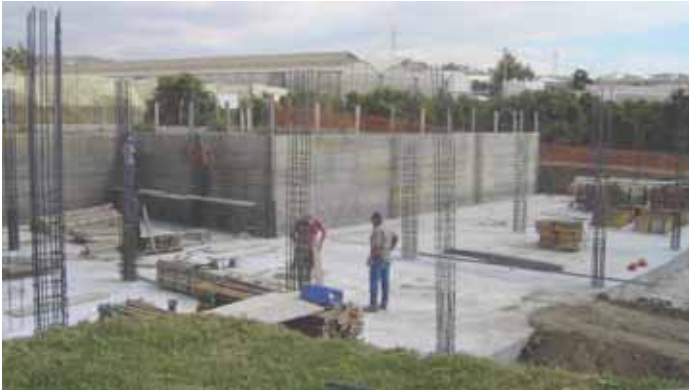
Las obras de la futura guardería infantil de la Costa ya han comenzado.

Las obras de la nueva guardería municipal en Algarrobo Costa ya han comenzado.