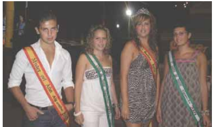
Los guapos de Algarrobo pasearon sus galardones durante la feria.