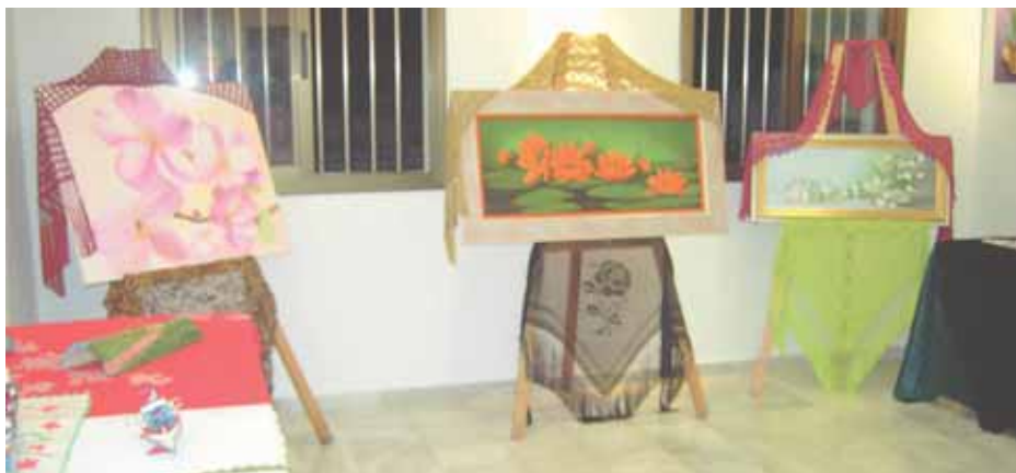
Los alumnos de los diferentes talleres de verano pudieron exponer sus obras en la sala de exposiciones

En total se han desarrollado tres talleres, uno de pintura, uno de baile y otro infantil. El de mayor participación ha sido el de pintura, que ha contado con la participación de 49 personas de todas las edades, que han realizado trabajos con diferentes técnicas. Los más pequeños también han disfrutado este verano de un taller propio al que han asistido 48 alumnos. Por último unas 27 personas han aprendido las bases de los bailes de salón.