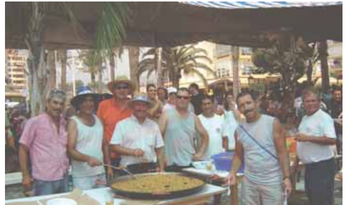
La Verbenas de Algarrobo Costa contó con un caldero marineru popular.