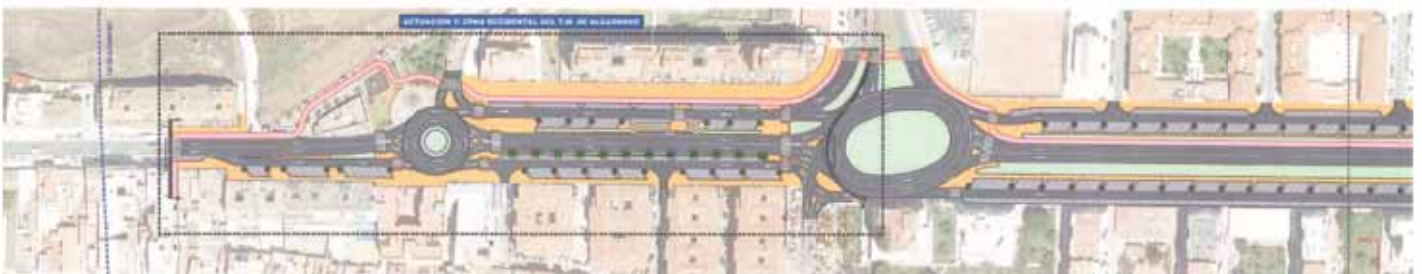
La Nacional 340 a su paso por Algarrobo Costa y Mezquitilla mejorará el tránsito e incluirá pasos de peatones elevados que reducirán la velocidad del tráfico.

PROPUESTA GENERAL DE REURBANIZACION DE LA CN-340 A SU PASO POR EL TERMINO MUNICIPAL DE ALGARROBO