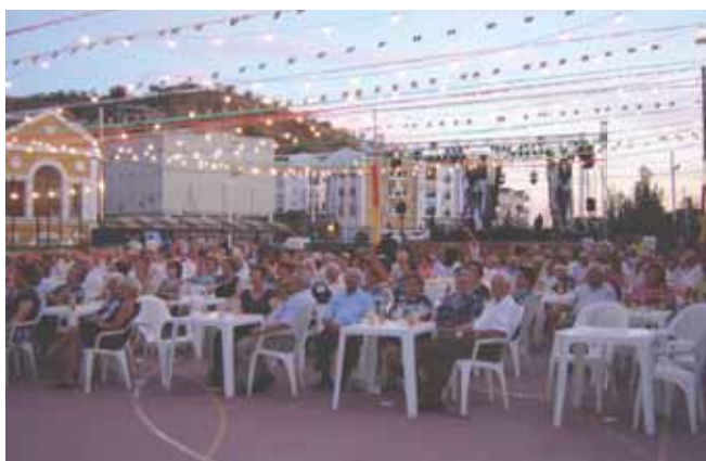
Homenaje a la Tercera Edad en la Feria de Algarrobo.