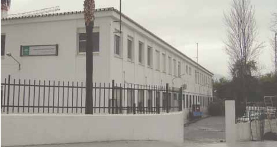
El Ayuntamiento ha cedido casi 3.000 metros para aumentar el espacio disponible del CEIP Enrique Ramos Ramos.

El Ayuntamiento ha cedido casi 3.000 metros cuadrados a la Junta de Andalucía y se ha comprometido en dotar a la parcela con los servicios necesarios y pavimentar los accesos