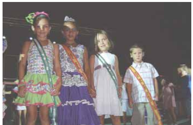
Los más guapos infantiles en Mezquitilla posaron como verdaderos modelos.