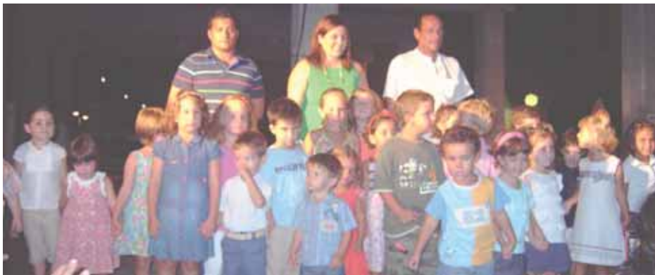
Las actividades organizadas por el Ayuntamiento contaron con un taller infantil para los pequeños.

La concejalía de Cultura ha celebrado 'El Paseo de la Creatividad' y clausurado las escuelas de verano 2009 en el paseo marítimo de Mezquitilla y la antigua Tenencia