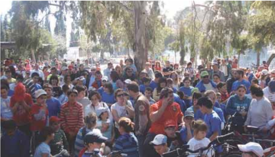
La XVIII Edición del Día del Pedal reunió a unos 355 ciclistas en la localidad

Las calles de Algarrobo se llenaron de bicicletas el pasado 8 de marzo con motivo del tradicional Día del Pedal que este año ha cumplido su XVIII edición. La popular prueba que tiene carácter lúdico y festivo, reunió a cientos de pequeños con sus bicicletas y sus familiares que no quisieron perderse esta cita tan especial. No importaba la edad, la única condición para participar era ir montado en una bicicleta. Esta décimo octava edición tuvo que ser suspendida en su primera convocatoria por las inclemencias del tiempo. Unos 355 ciclistas, medio centenar más que el año pasado, pasearon por las calles de la localidad en un