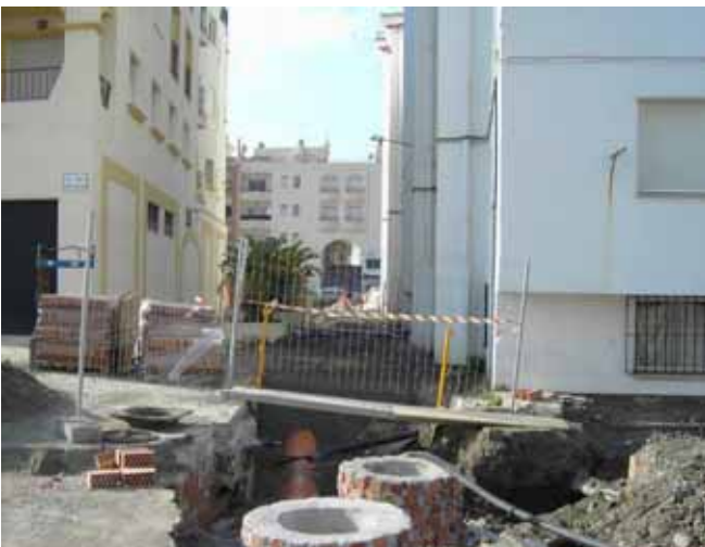
Comienzan las obras en la calle Virgen de Fátima (Mezquitilla)