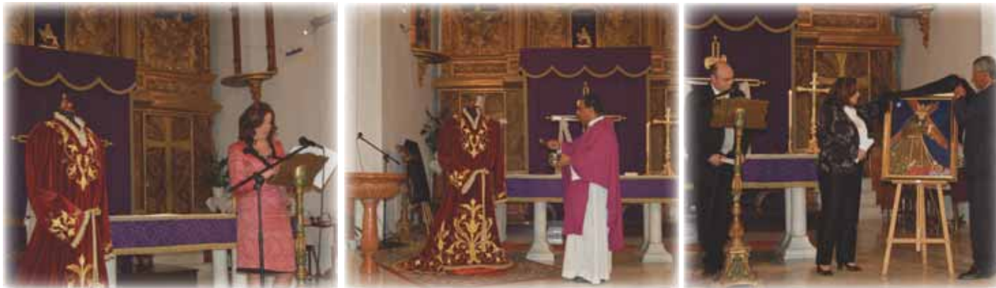
La bendición de la túnica, la presentación del cartel anunciador y el pregón inauguran los actos de la Semana Santa algarrobeña.

Nuestro Padre Jesús estrenará en procesión el Jueves Santo, 9 de abril, una nueva túnica que ha sido confeccionada por la Asociación de la localidad 'Dolores Rivas'.