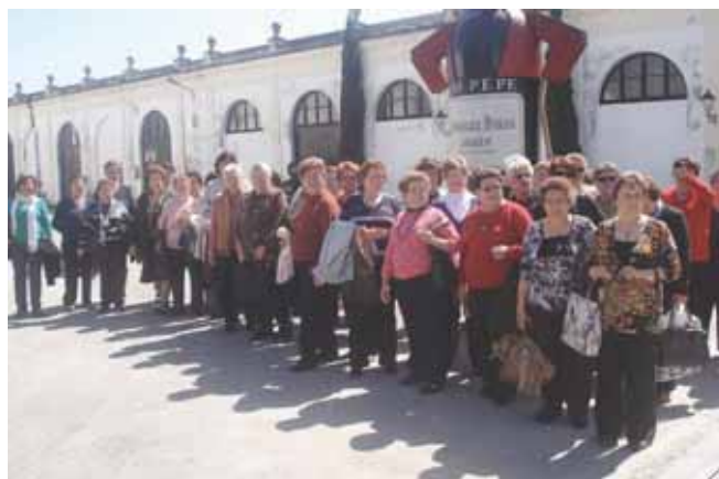
Viaje a Jerez de la Frontera en la Semana de la Mujer . / Redacción

La semana de la Mujer concluyó con una visita a Jerez de la Frontera, del viaje disfrutaron 150 mujeres que compartieron una jornada llena de actividades como la visita a las bodegas 'Tío Pepe'.