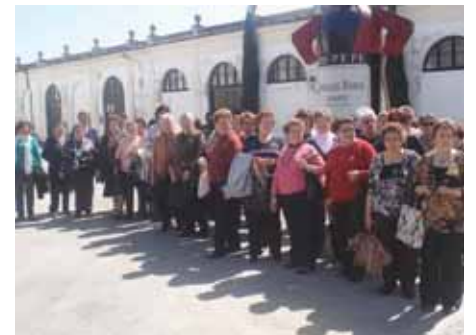
Besuch der Bodega Tio Pepe

Von Monat zu Monat werden Nachrichten über Sport, Kultur, Tourismus, Serviceleistungen und Projekte usw. veröffentlicht, die in Ihrem Interesse sind. Wir hoffen das Ihr diese Zeitschrift genießt und alle Informationen darin findet die zum täglichen Leben dazugehören.