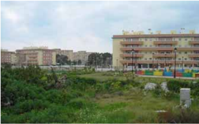
Terrenos destinados a la construcción de la guardería.

La iniciativa, que supondrá una inversión de 492.842 euros , evitará que los padres tengan que desplazar a sus hijos hasta otros municipios del entorno