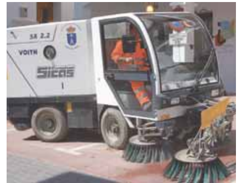
Más limpieza en las calles del pueblo

Las calles del municipio presentarán un aspecto más limpio gracias a la barredora que ha adquirido el consistorio. Con esta nueva máquina lo que se pretende es ofrecer un mejor servicio en materia de limpieza.