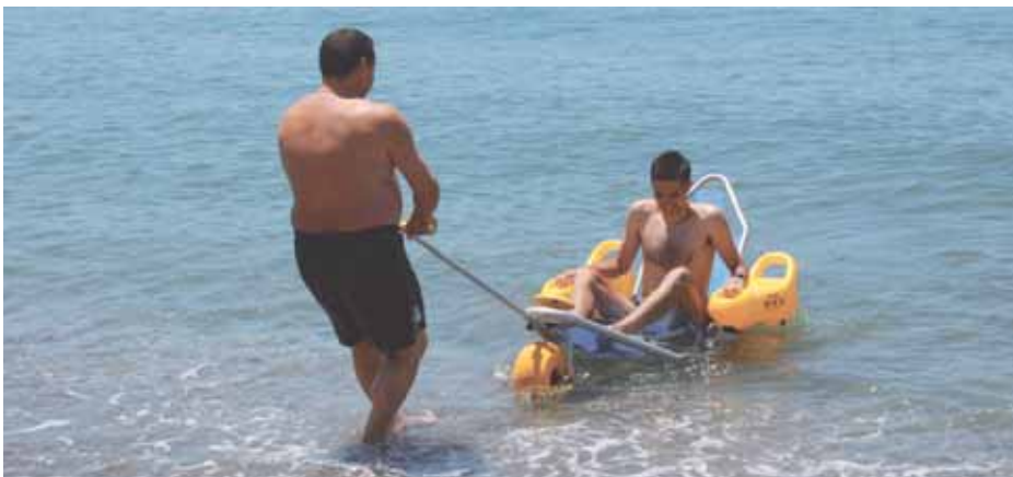
Este año las personas con algún tipo de discapacidad podrán bañarse gracias a las sillas anfibia.

Por otro lado también se ha querido recordar a todos los familiares de las personas que necesiten la silla anfibia para bañar a sus familiares, que pueden disponer de ella acercándose al puesto de socorro.