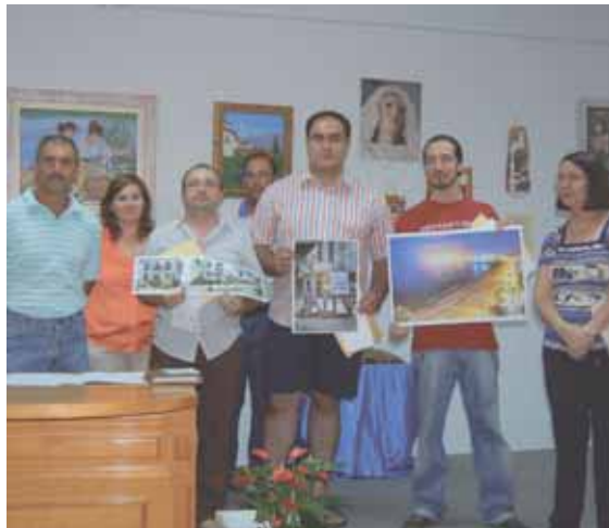
Los premiados en el Maratón Fotográfico muestran las fotos ganadoras

El autor que tuvo la oportunidad de leer varios fragmentos de su libro durante la inauguración, expresó el cariño especial que le tiene a su reciente obra ‘Tardes de lluvia’, aunque co-